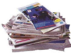
Journaux, revues, magazines