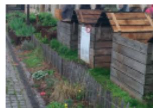
Composteurs en pied d'immeuble

Le SYMSEM, instruira la demande et décidera de la faisabilité de votre projet.